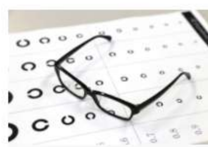
延伸閱讀：漸進鏡片問與答

可是，受制於鏡片打磨技術，看遠、中、近的度數，都壓縮在漸進鏡片中央的部位（「度數區」），而兩旁總會留有「視覺扭曲區」（Distortion zone），形狀有如蝴蝶的翅膀（見圖）。當視線落在這個區域上，所看到的影像便呈扭曲或虛浮，感到不「實在」。