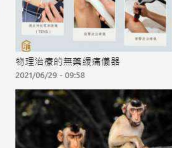
物理治療的無痛經痛儀器