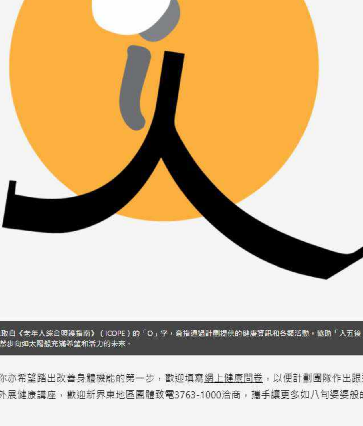
▲ 計劃標誌的概念取自《老年人綜合照護指南》（ICOPE）的「O」字，意指通過計劃提供的健康資訊和各項活動，協助「人」活得更健康耆年，昂然步向如太陽般充滿希望和活力的未來。

幸好，上文提及的八旬婆婆在社區推廣活動當日剛巧經過街站，並接受了基本的健康測試，讓計劃團隊得以了解其健康狀況，從而轉介她參與合適的訓練和活動。其後，計劃團隊更邀請了其家人陪同婆婆到中心作進一步評估，並在得知她已確診早期認知障礙症，且每日需服用逾十種藥物的情況後，立即將個案轉介至中心另一健康護理計劃，以提供長遠協助。現時，婆婆幾乎每星期都會到中心參與不同活動，亦愛與中心同事、會員聊天，生活漸漸變得不一樣！