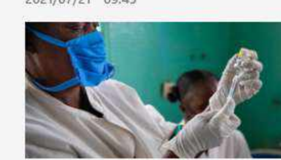
疫症最新研究 意國小鎮康復者抗體可達至少 9 個月