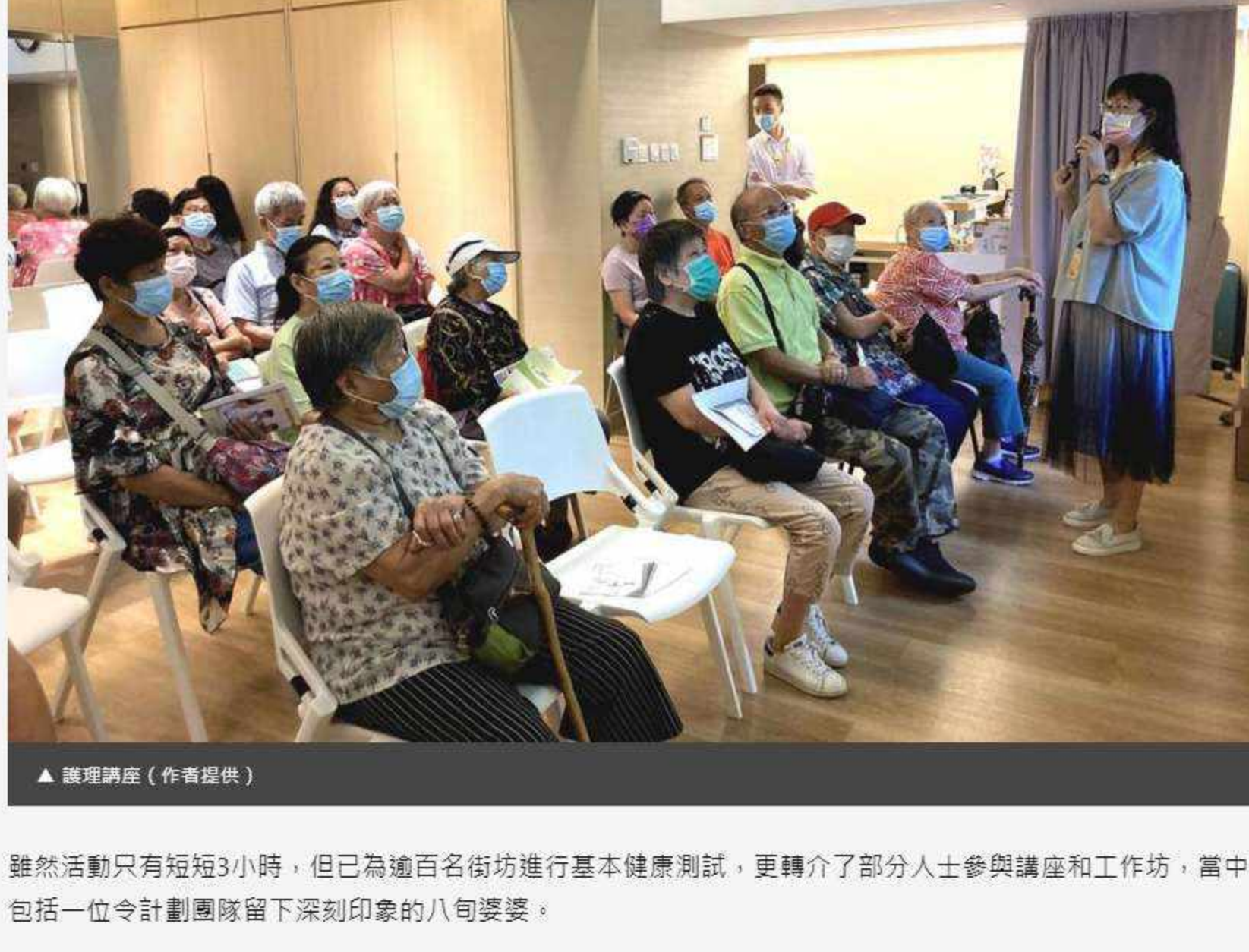
▲ 護理講座

雖然活動只有短短3小時，但已為逾百名街坊進行基本健康測試，更轉介了部分人士參與講座和工作坊，當中包括一位令計劃團隊留下深刻印象的八旬婆婆。