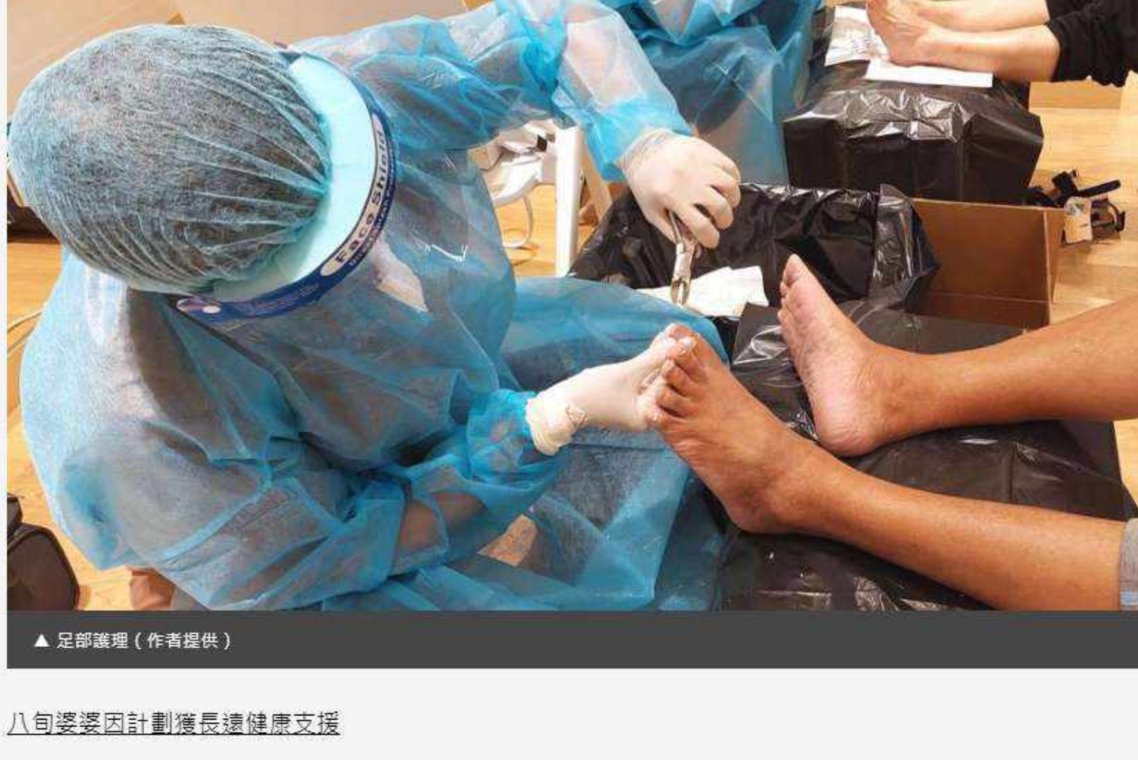
▲ 足部護理