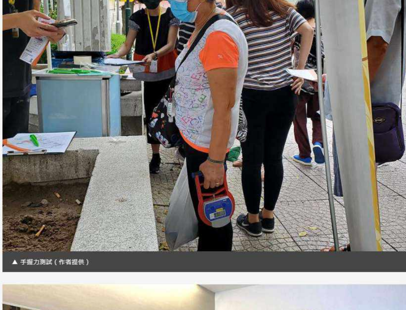
▲ 手擲力測試

為擴大計劃受惠層面，計劃團隊除了與地區組織合作，向其服務使用者提供健康問卷調查和跟進，亦於上月底首度舉辦社區推廣活動，為街坊進行問卷調查的同時，更提供手擲力、體重指標（BMI）、血壓及動脈硬化評估等基本測試，並設營養飲食和護理講座，藉此提高他們對自我健康管理的關注。