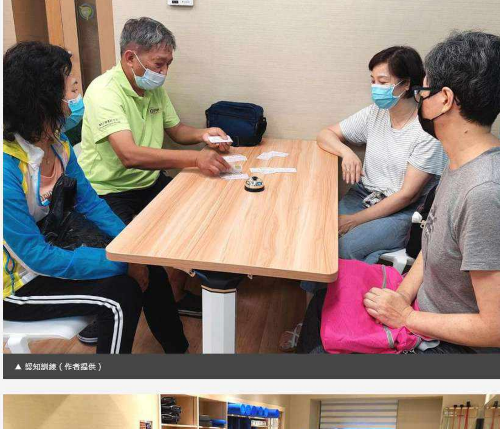
▲ 認知訓練