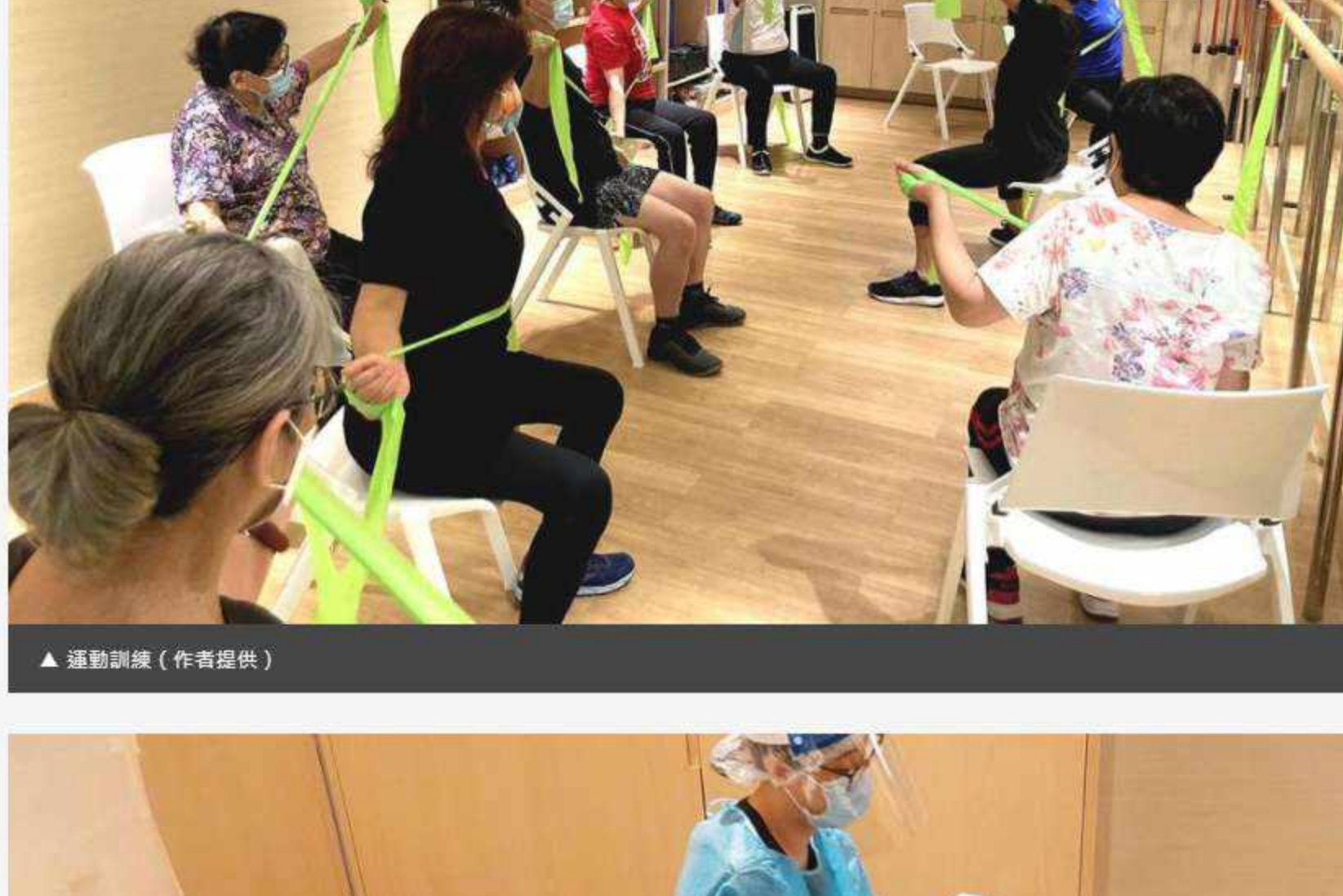
▲ 運動訓練