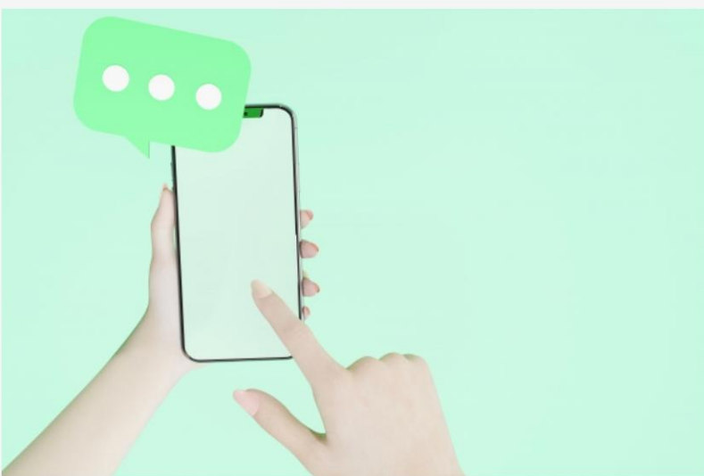
善用手機的即時通訊軟件，有助改善與聽力缺失人士的溝通。